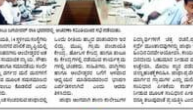
ಸಂವಿಧಾನ ಜಾಗೃತಿ ಜಾಥಾ ಜಿಲ್ಲೆಯಾದ್ಯಂತ ಸಂಚಾರ... ಸಂವಿಧಾನ ಜಾಗೃತಿ ಜಾಥಾ ಜಿಲ್ಲೆಯಾದ್ಯಂತ ಸಂಚಾರ...