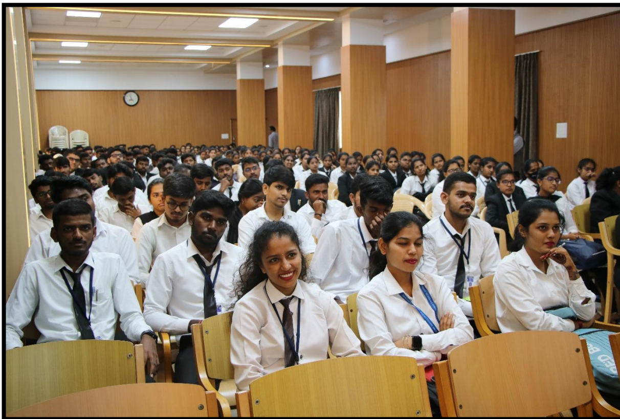
The Students of Vidyavardhaka Law College, listening to the Inaugural Address.