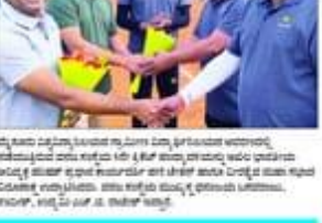
ಪಾರಂಪರಿಕ ವೈದ್ಯರ ಸಮಸ್ಯೆಗಳನ್ನು ಸರ್ಕಾರ ಈ ಕೂಡಲೇ ಬಗ್ಗಬರಿಸಲಿ... ಪಾರಂಪರಿಕ ವೈದ್ಯರ ಸಮಸ್ಯೆಗಳನ್ನು ಸರ್ಕಾರ ಈ ಕೂಡಲೇ ಬಗ್ಗಬರಿಸಲಿ...