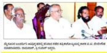
ತಿಲೆ ಸಿಕ್ಕ ಜಾಗದಲ್ಲೇ ರಾಮಮಂದಿರ ನಿರ್ಮಾಣಕ್ಕೆ ಭೂಮಿಪೂಜೆ ನಡೆಸಿದ ನಂತರ... ತಿಲೆ ಸಿಕ್ಕ ಜಾಗದಲ್ಲೇ ರಾಮಮಂದಿರ ನಿರ್ಮಾಣಕ್ಕೆ ಭೂಮಿಪೂಜೆ ನಡೆಸಿದ ನಂತರ...