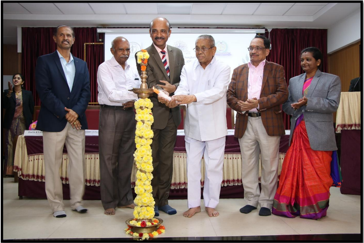
The formality of the programme -lighting of the lamp.

‘Legal profession and legal studies, which were seen as very poor in the seventies and eighties have now been given an important place above all professional education. Three or four decades ago, law studies in Kannada were impossible. But, now the privileges of studying the most difficult subjects of law in Kannada have been built. Students studying law in Kannada need not suffer from inferiority complex. It is something we all should be proud of that Kannada medium students, especially students from rural areas, are entering the profession of lawyers in the highest number today’, said H.K. Jagadish, Special Secretary, Law Department, Government of Karnataka, in the inaugural program of the Inauguration of Academic Activities of Vidyavardhaka Law College.